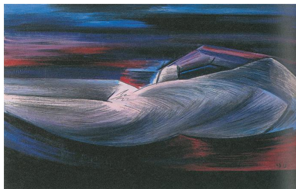
『無題（宇宙的裸婦）』 1959 年